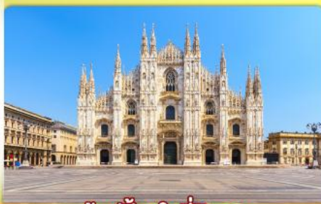
ซอปป์ิงจู่ที่มิลาน