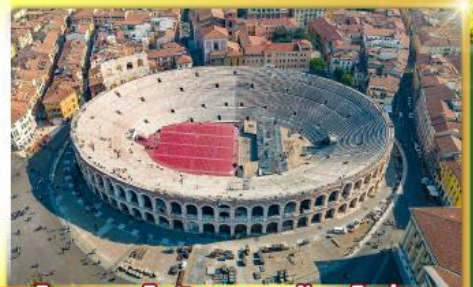
โรงละครโรมันกลางจัหวัดโรมน่า