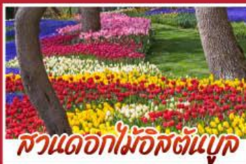
สวนดอกไม้อิสตันบูล