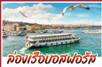
ล่องเรือบอสฟอรัส