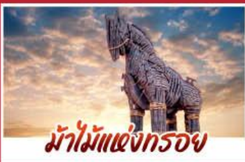
ม้าไม้แห่งกรอย