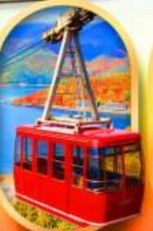
ขึ้นกระเช้าทะเลสาบมิกะตะ