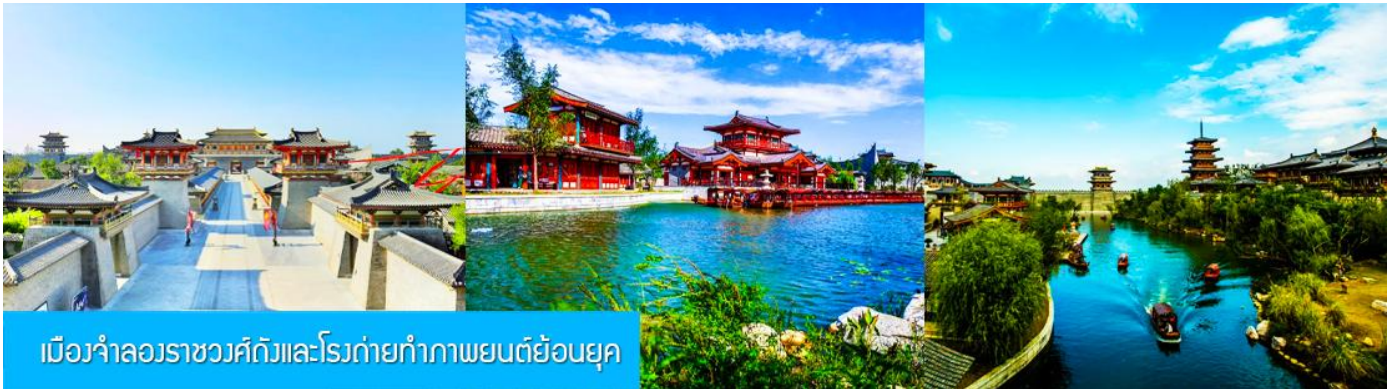
เมืองจำลองราชวงศ์ถังและโรงถ่ายทำภาพยนตร์ย้อนยุค