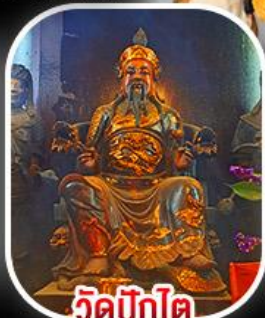
วัดปังกโต