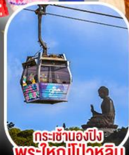
กระเช้าเองปีง พระใหญ่ไ่่วหลิน