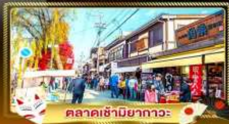
ตลาดซามิยากาวะ