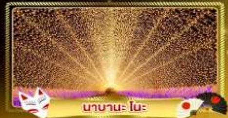
นานาะ โนะ