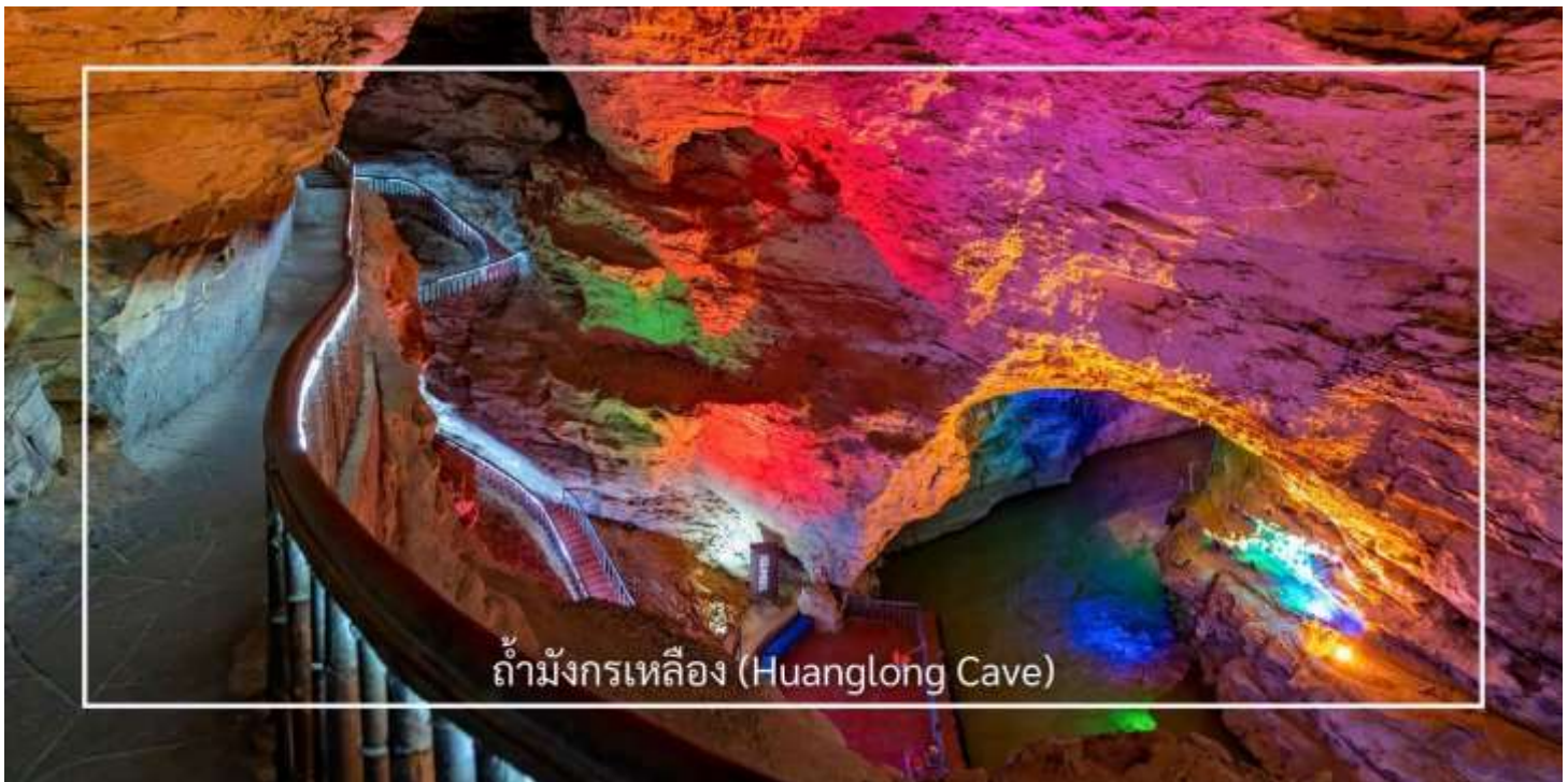
ถ้ามังกรเหลือง (Huanglong Cave)

ท่านสามารถเลือกซื้อบริการเสริม (Option) เพิ่มเติมได้: ถ้ามังกรเหลือง (รวมล่องเรือชมแสงสีในถ้ำ ราคา 350หยวน/ท่าน) ถ้ามังกรเหลือง หนึ่งในถ้ำหินงอกหินย้อยที่ยิ่งใหญ่และงดงามที่สุดของเมืองจางเจี๋ยเจี๋ย แหล่งท่องเที่ยวทางธรรมชาติที่ได้รับการยกย่องว่าเป็น “พระราชวังใต้พิภพ” แห่งดินแดนอุ่หลิงหยวน ถ้ำแห่งนี้มีโครงสร้างขนาดใหญ่ แบ่งออกเป็น 4 ชั้น ภายในประกอบด้วยห้องโถงกว้างใหญ่ ลำธารใต้ดิน บึงธรรมชาติ และแนวระเบียงหินที่ทอดยาวอย่างน่าตื่นตา ความมหัศจรรย์ของหินงอกหินย้อยซึ่งก่อตัวสะสมมาเป็นเวลาหลายล้านปี ได้รับการจัดแสงอย่างสวยงาม ช่วยขับเน้นรูปร่างแปลกตาให้โดดเด่นราวงานศิลป์จากธรรมชาติ สัมผัสประสบการณ์ ล่องเรือชมแสงสีภายในถ้ำ โดยเรือจะนำท่านลัดเลาะไปตามสายน้ำใต้ถ้ำให้ท่านได้สัมผัสกับความยิ่งใหญ่ของธรรมชาติอันน่าอัศจรรย์ได้อย่างใกล้ชิด