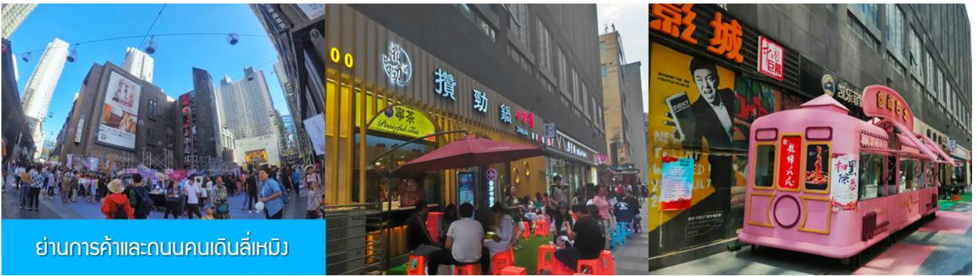
ย่านการค้าและถนนคนเดินลี่เหมิง

หลังอาหารนำท่านสู่ ย่านการค้าและถนนคนเดินลี่เหมิง 力盟商业步行街 ย่านการค้าทันสมัยที่มีห้างสรรพสินค้าขนาดใหญ่หลายแห่ง ถนนคนเดินที่คึกคักไปด้วยร้านค้าแบรนด์ท้องถิ่น ร้านอาหารพื้นเมือง ร้านสะดวกทานฟาสต์ฟู้ด ให้เวลาอิสระท่านเดินช้อปปิ้ง ชิมอาหารพื้นเมืองเต็มที่