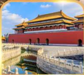
พระราชวังต้องห้าม