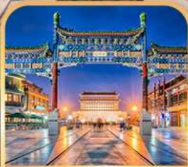
ถนนเจียนเหมิน