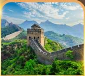
กำแพงเมืองจีน