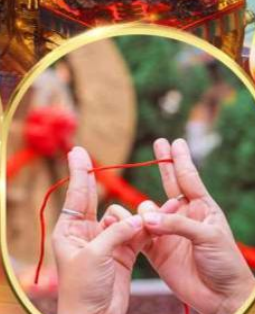
พิธีเทพเจ้าค้ายาง