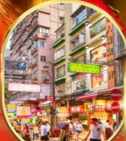
ช้อปปิ้ง ย่านจิมซาจุ่ย