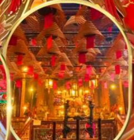
วัดม่านไหม