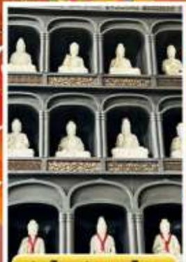
วัดโดฮิซังเซอิโดจิ