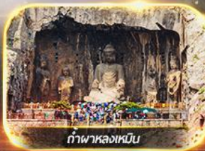
ถ้ำพาลงเหมิน