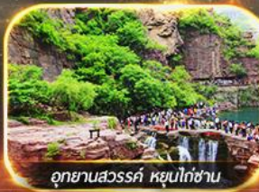
อุทยานสวรรค์ หยุนโก่ซาน