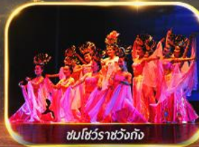
ชมโชว์ราชวงศ์ถัง

นั่งรถไฟความเร็วสูง ย้อนประวัติศาสตร์อันยิ่งใหญ่ "กองทัพทหารจีนซี" สัมผัสความงามอุทยานสวรรค์ พิเศษ!! ชมโชว์ราชวงศ์ถัง เก็บครบทุกไฮไลต์ ซอปปิงจู่จิว ห้าง WU YUE