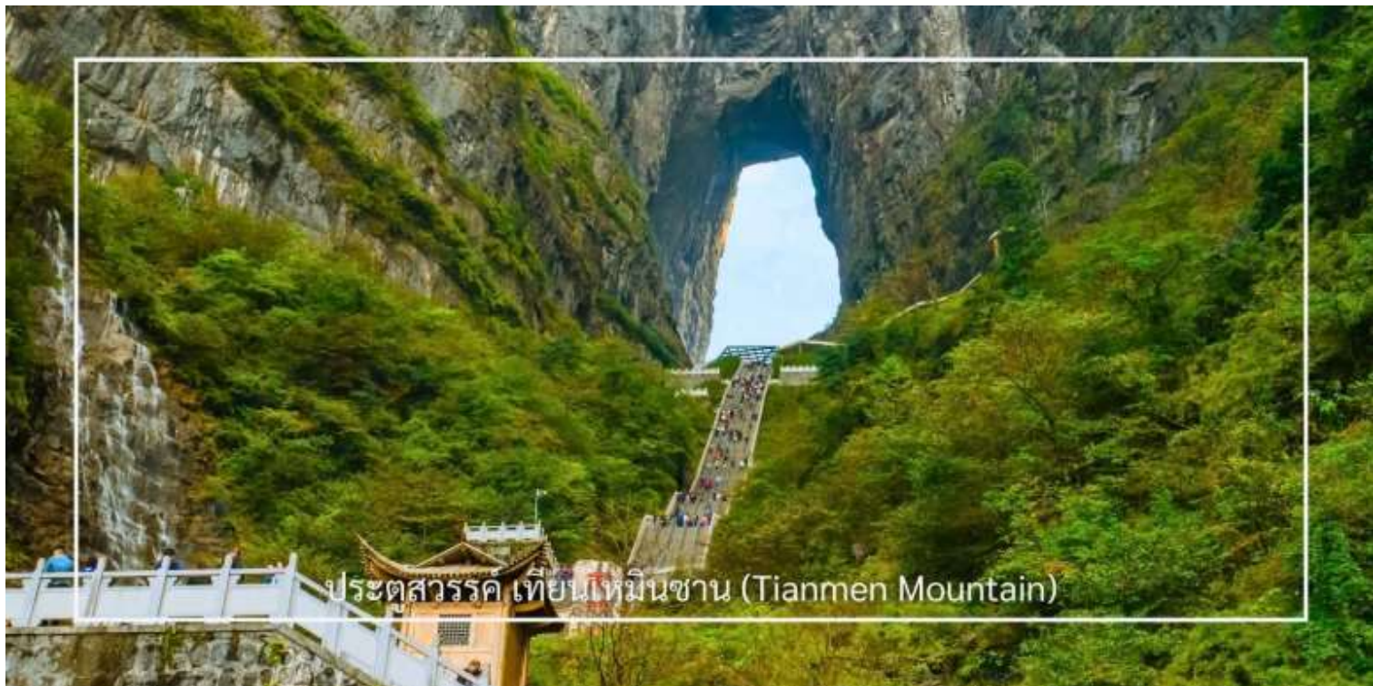
ประตูสวรรค์ เทียนเหมินซาน (Tianmen Mountain)

เสียดฟ้า เมื่อถึงยอดเขาเทียนเหมินซาน นำคณะเดินตามเส้นทางขมวิวเลียบบนภูเขาและหน้าผา ชมทัศนียภาพจากมุมสูงบนยอดเขา ทำหายความกล้าของท่านด้วยการเดินบนพื้นกระจกใสของ ระเบียงแก้ว กระจกใส่ียบหน้าผา จากนั้นนำท่านสู่ ประตูสวรรค์ โดย บันไดเลื่อนที่สร้างขึ้นโดยการเจาะทะลุภูเขาที่เรียงติดต่อกันถึง 5 ตอน เป็นเครื่องอำนวยความสะดวกใหม่ล่าสุดของ เขาเทียนเหมินซาน ท่านจะได้ถ่ายภาพ ประตูสวรรค์ อย่างใกล้ชิด