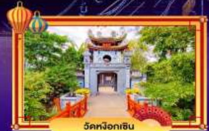
วัดน็อกอิน