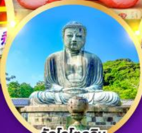
วัดโคโคคุอิน