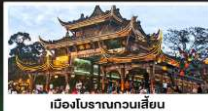
เมืองโบราณทวนเสียน