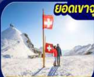
ยอดเขาวงพร้าว