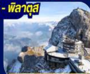
ยอดเขาพิลาตุส

นั่งรถไฟ Bernina Express เส้นทางรถไฟสายมรดกโลก