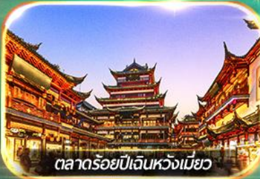
ตลาดร้อยปีเงินหวงเมี่ยว