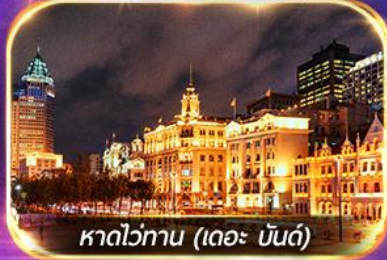
หาดวอگان (เดอะ บันด์)

เที่ยวดิสนีย์แลนด์เต็มวัน (รวมรถรับ-ส่ง)