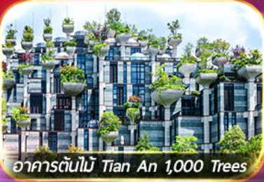
อาคารต้นไม้ Tian An 1,000 Trees