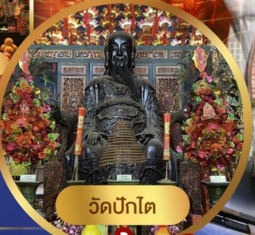
วัดปักโต