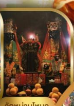
วัดผานไหว