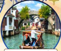
เมืองโบราณจูเจียเจีย