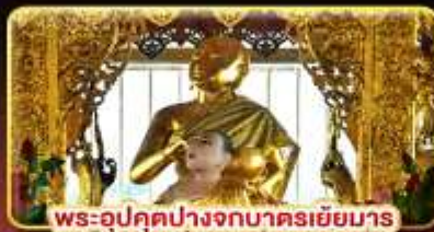
พระอุปลุกปางจกบาตรเยี่ยมมาร