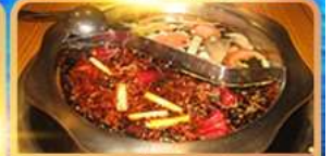
สุกี้ท้องถิ่น