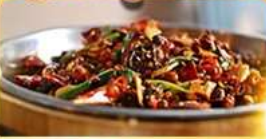
อาหารเสฉวน