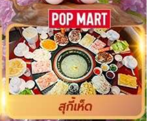
POP MART สุกี้เห็ด