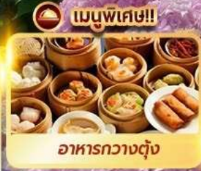
เมนูพิเศษ!! อาหารกวางตุ้ง