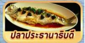
ปลาประรานาธิบดี