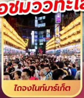
ไถจงไนท์มาร์เก็ต