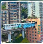
รถไฟฟ้า-สุตึก