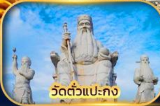
วัดตัวแปะกง