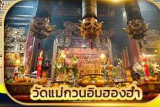
วัดแม่กวนอิมฮ่องฮ่า