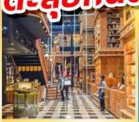
ร้านไอศกรีมมียาฮาร์