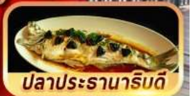
ปลาประรานาภิรมดี