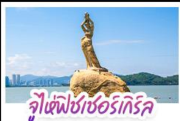
จุ๊เซฟิซเซอร์ทริคัล