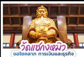
วัดแห่งกวงเมียว ขอโชคลาภ การเงินและธุรกิจ