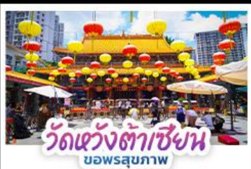
วัดแห่งต้าเซียน ขอพรสุขภาพ