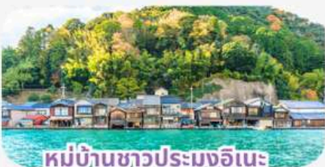
หมู่บ้านชาวประมงอิเนะ