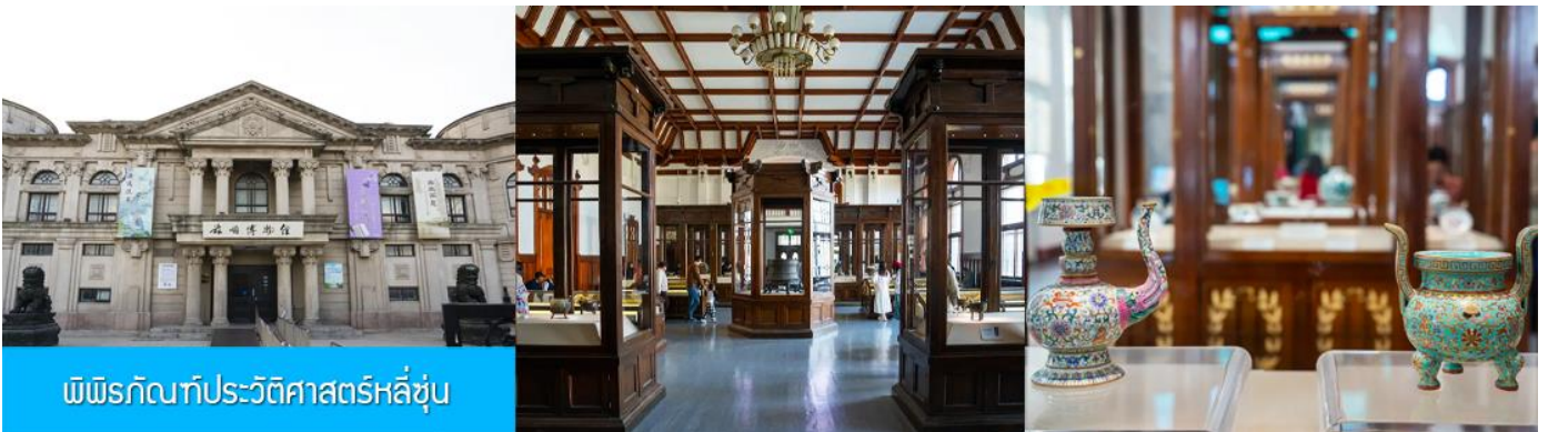
พิพิธภัณฑ์ประวัติศาสตร์หลี่ซุ่น

นำท่านเที่ยวชมและเก็บภาพ ณ สถานีรถไฟหลี่ซุ่น 旅顺火车站 เป็นสถานีปลายทางของเส้นทางรถไฟสาขา เลิ่นหยาง - ต้าเหลียน สร้างขึ้นในปีค.ศ. 1903 ออกแบบโดยสถาปนิกชาวรัสเซีย เป็นอาคารอิฐก่อปูนผสม โครงสร้างไม้ตามสถาปัตยกรรมรัสเซีย.