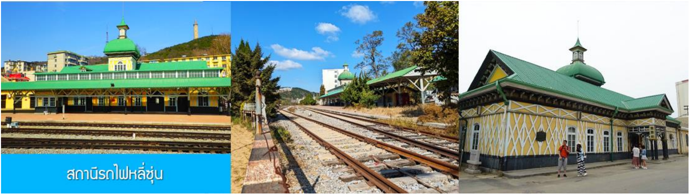
สถานีรถไฟหลี่ซุ่น

นำท่านเที่ยวชมและเก็บภาพ ณ สถานีรถไฟหลี่ซุ่น 旅顺火车站 เป็นสถานีปลายทางของเส้นทางรถไฟสาขา เลิ่นหยาง - ต้าเหลียน สร้างขึ้นในปีค.ศ. 1903 ออกแบบโดยสถาปนิกชาวรัสเซีย เป็นอาคารอิฐก่อปูนผสม โครงสร้างไม้ตามสถาปัตยกรรมรัสเซีย.