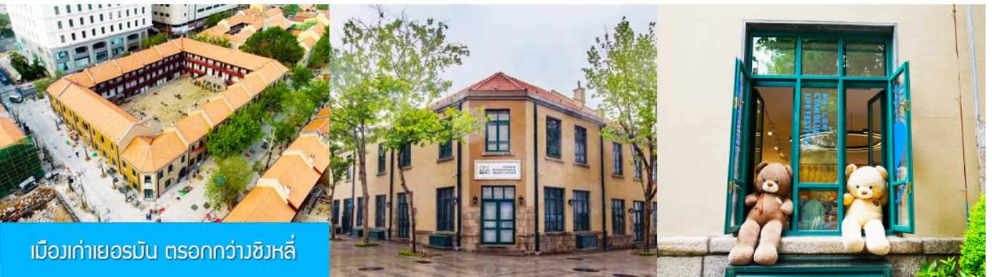
เมืองเก่าเยอรมัน ตรอกกว้างชิงหลี่

จากนั้นนำท่านเดินเที่ยวชม ถนนจงซาน 中山路 ถนนที่เต็มไปด้วยกลิ่นอายยุโรป และถนนสายนี้มีบันทึกเรื่องราวมากกว่าศตวรรษของเมืองชิงเต่าไว้ ที่นี่เป็นศูนย์กลางการค้าแห่งแรกที่เต็มไปด้วยสถาปัตยกรรมสไตล์ยุโรปเก่าแก่ที่ได้รับอิทธิพลมาจากเยอรมัน ให้ท่านได้เดินเก็บบรรยากาศ และ เก็บภาพกับโบสถ์เซนต์ไมเคิล (ด้านนอก) โบสถ์แห่งนี้ที่คู่รักนิยมมาถ่ายภาพงานแต่งงานมากที่สุดในเมืองชิงเต่า ให้ท่านถ่ายรูปเก็บภาพ