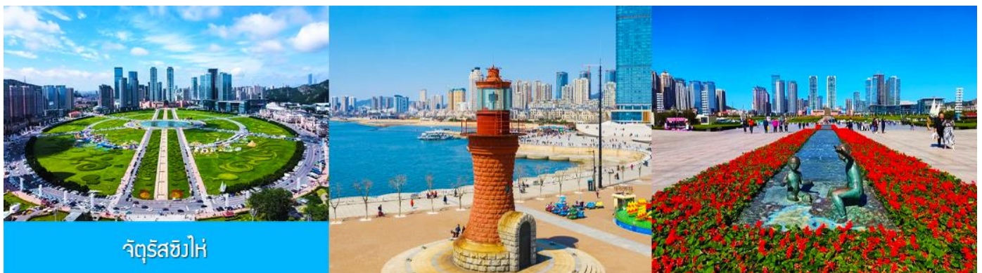
จัตุรัสซีไห่

จากนั้นนำท่านเที่ยวชมและเก็บภาพ ณ พิพิธภัณฑ์ประวัติศาสตร์หลี่ซุ่น 旅顺博物馆 เป็นอาคารพิพิธภัณฑ์เก่าแก่อายุกว่าร้อยปีแห่งแรกที่สร้างขึ้นทางภาคตะวันออกเฉียงเหนือของจีน อาคารพิพิธภัณฑ์มีความโดดเด่นด้วยสถาปัตยกรรมแบบกรีกโรมันยุคเรเนซองส์ ผสมผสานสถาปัตยกรรมแบบตะวันตก ภายในมีการจัดแสดงโบราณวัตถุกว่า 60,000 ชิ้น ท่านสามารถเก็บภาพที่ระลึกด้านหน้าอาคารพิพิธภัณฑ์ และสามารถเข้าชมโบราณวัตถุภายในพิพิธภัณฑ์ได้ตามอัธยาศัย (พิพิธภัณฑ์เปิดทุกวันจันทร์)..