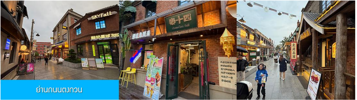
ย่านถนนตวงกวน

นำท่านเที่ยวชม จัตุรัสชิงไห่ 星海广场 เป็นจัตุรัสขนาดใหญ่เป็นแลนด์มาร์คสำคัญของเมืองต้าเหลียน สร้างขึ้นเพื่อเฉลิมฉลองในโอกาสที่รัฐบาลอังกฤษคืนเกาะฮ่องกงในให้จีนในปี ค.ศ. 1997 ตั้งอยู่ชายฝั่งทะเลในเมืองต้าเหลียน เป็นจัตุรัสใจกลางเมืองที่ใหญ่ที่สุดในโลกและ เป็นแลนด์มาร์คของเมืองต้าเหลียน รายล้อมด้วยตึกกระจาที่ทันสมัย ภายในมีบ่อน้ำพุดนตรี ลานหญ้าขนาดใหญ่ และลานกว้างสำหรับจัดกิจกรรมกลางแจ้ง อาทิ เทศกาลเบียร์นานาชาติ การแข่งขันวิ่งมาราธอน งานแฟชั่นนานาชาติเมืองต้าเหลียน ฯลฯ