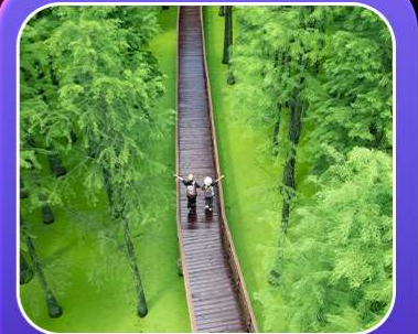
“ป่าสนชิงซาน”

T2G-HGH01GJ Welcome Hangzhou...หังโจว ฉู่โจว ฉู่หยวน ช่างเหรา หุบเขาเทวดา 5D 4N (GJ)