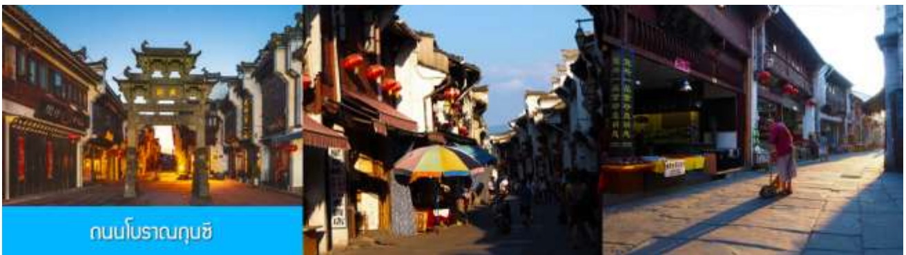
ถนนโบราณฉุนซี

อิสระอาหารมื้อกลางวัน ( ท่านสามารถเลือกชิมอาหารพื้นเมืองในระแวกโรงแรมได้ตามอัธยาศัย )