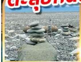
หาดซีชิง

เดินชมวิวเกาะเหอผิง ตะลุยกินตลาดมิชลินที่เราหา