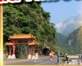
อุทยานทาโรโกะ