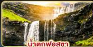
น้ำตกฟอสซา