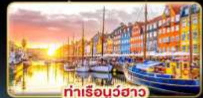
ท่าเรือบูธาว