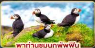
พาท่านชมนกพัฟฟิน