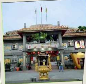
วัดจินซาน (โชคลาก)