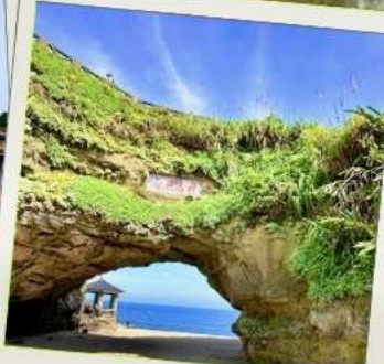
ถ้ำสี่เหมิน