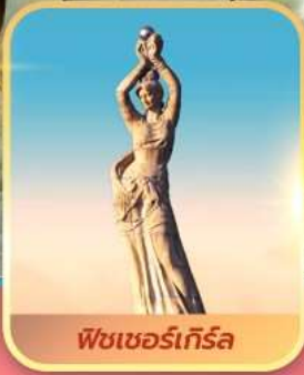
พีชเซอร์เกิร์ล