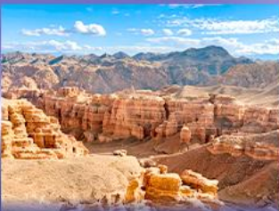
หุบเขาซาริน แคนยอน