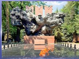
สวนสาธารณะ 28 Panfilov Park