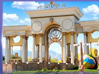
สวนสาธารณะประธาธิบดี