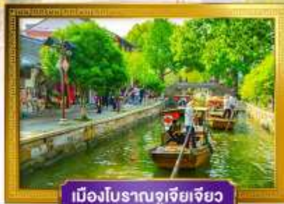
เมืองโบราณซูโจว