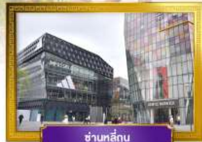
ชานหลู่กู่