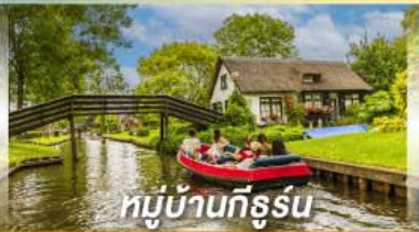
หมู่บ้านทึร์รูน