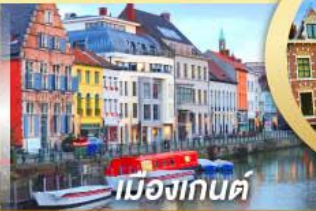
เมืองกันต์