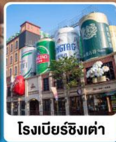
โรงเบียร์ชิงเต่า