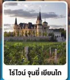
ไร่ไวน์ จุนยี่ เยียนไถ