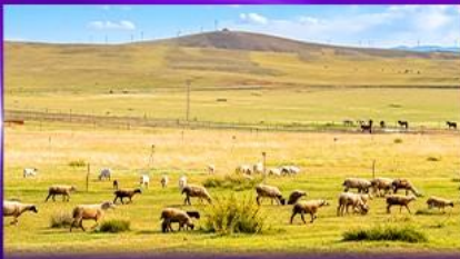
ทุ่งหญ้าชิลามูเฮริน