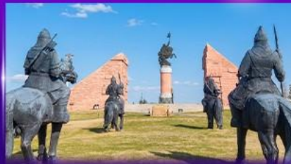
สวนสาธารณะเจงกิสข่าน