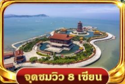
จุดชมวิว 8 เซียน