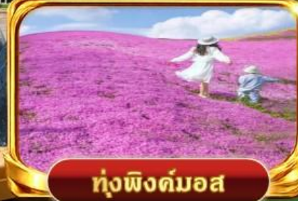
ท่งฟิงคิมอส