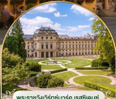
พระราชวังเวิร์ทซ์บวร์ค เรสซิเดนซ์