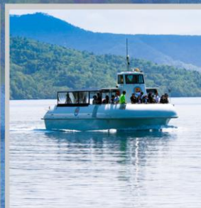
"LAKE SHIKOTSU GLASS BOAT"