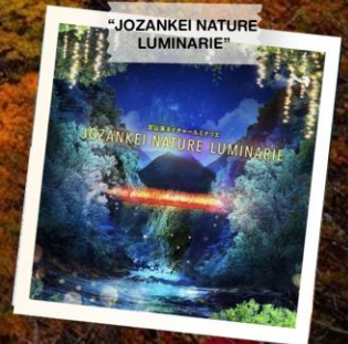
"JOZANKEI NATURE LUMINARIE"

วันเดินทาง 23 - 28 ต.ค. 2569 (วันปืยมหาราช) 28 ต.ค. - 2 พ.ย. 2569 30 ต.ค. - 4 พ.ย. 2569