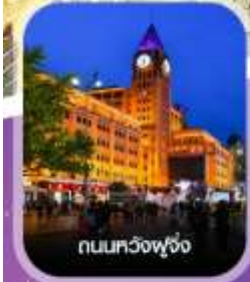
ถนนทวิงฟู่จิ่ง