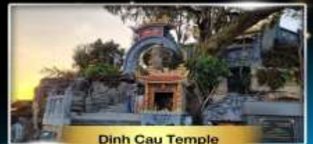
Dinh Cau Temple