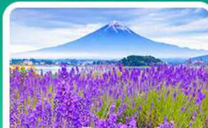
สวนโออิชิปาร์ก