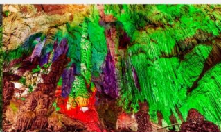
กำแพงหงดั่ง