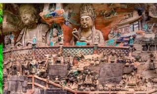
ผาหินแกะสลักต้าจู่ เป่าติงซาน