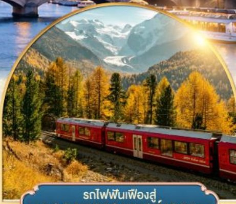
รถไฟฟันเฟืองสู่ ยอดเขากรอนเนอ์เกรต